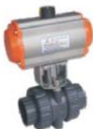
ZS4175系列: 气动塑料球阀