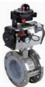
ZS5162系列： 气动衬氟法兰蝶阀