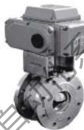
ZS4342系列: 气动V型软密封超薄调节球阀