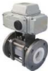
ZS4382系列(固定球): 电动陶瓷球阀