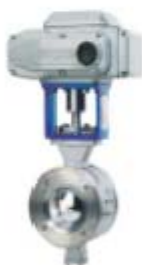
ZS4331系列: 电动对夹V型硬密封调节球阀