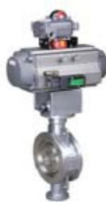
ZS5131系列： 气动三偏心硬密封对夹蝶阀