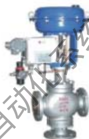
ZS8112系列: 气动薄膜三通调节阀