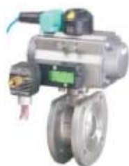
ZS4112系列: 气动O型软密封超薄球阀