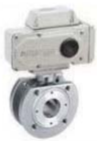
ZS4312系列: 气动O型软密封超薄球阀