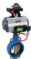
ZS5111系列： 气动衬胶中线蝶阀