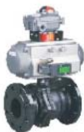
ZS4112系列: 气动O型软密封法兰球阀