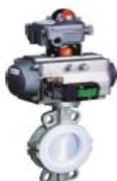
ZS5161系列： 气动衬氟中线蝶阀