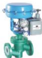
ZS1232系列: 气动薄膜衬氟单座调节阀