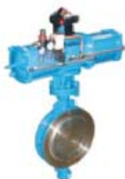
ZS5121系列： 气动高性能对夹蝶阀