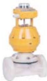
ZS6122系列: 气动全塑隔膜阀