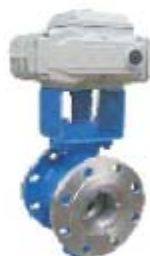
ZS4332系列: 气动V型硬密封偏心调节球阀