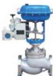
ZS3212系列: 气动薄膜套筒调节阀