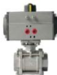
ZS4113系列: 气动O型软密封螺纹球阀