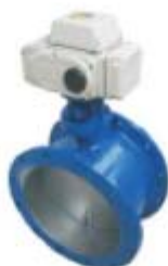
ZS5352系列： 电动低负载调节蝶阀