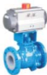
ZS4182系列: 气动O型衬氟法兰球阀