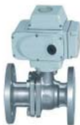
ZS4312系列: 电动O型软密封法兰球阀