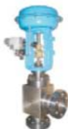
ZS1242系列: 气动薄膜单座角形调节阀