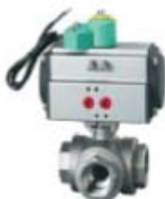
ZS4163系列: 气动三通螺纹球阀