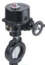
ZS5311系列： 电动衬胶中线蝶阀