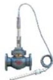
ZS7242系列: 自力式温度控制调节阀