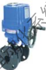
ZS4322系列: 电动O型硬密封球阀