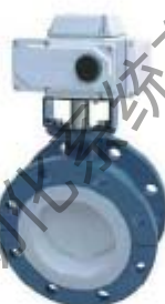
ZS5362系列： 电动衬氟法兰蝶阀