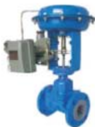
ZS6222系列: 气动衬氟隔膜调节阀