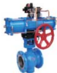
ZS4112系列(固定球): 气动O型软密封法兰球阀