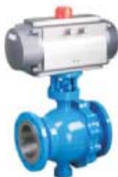
ZS4122系列: 气动O型硬密封法兰球阀