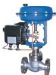
ZS1212系列: 气动薄膜单座调节阀